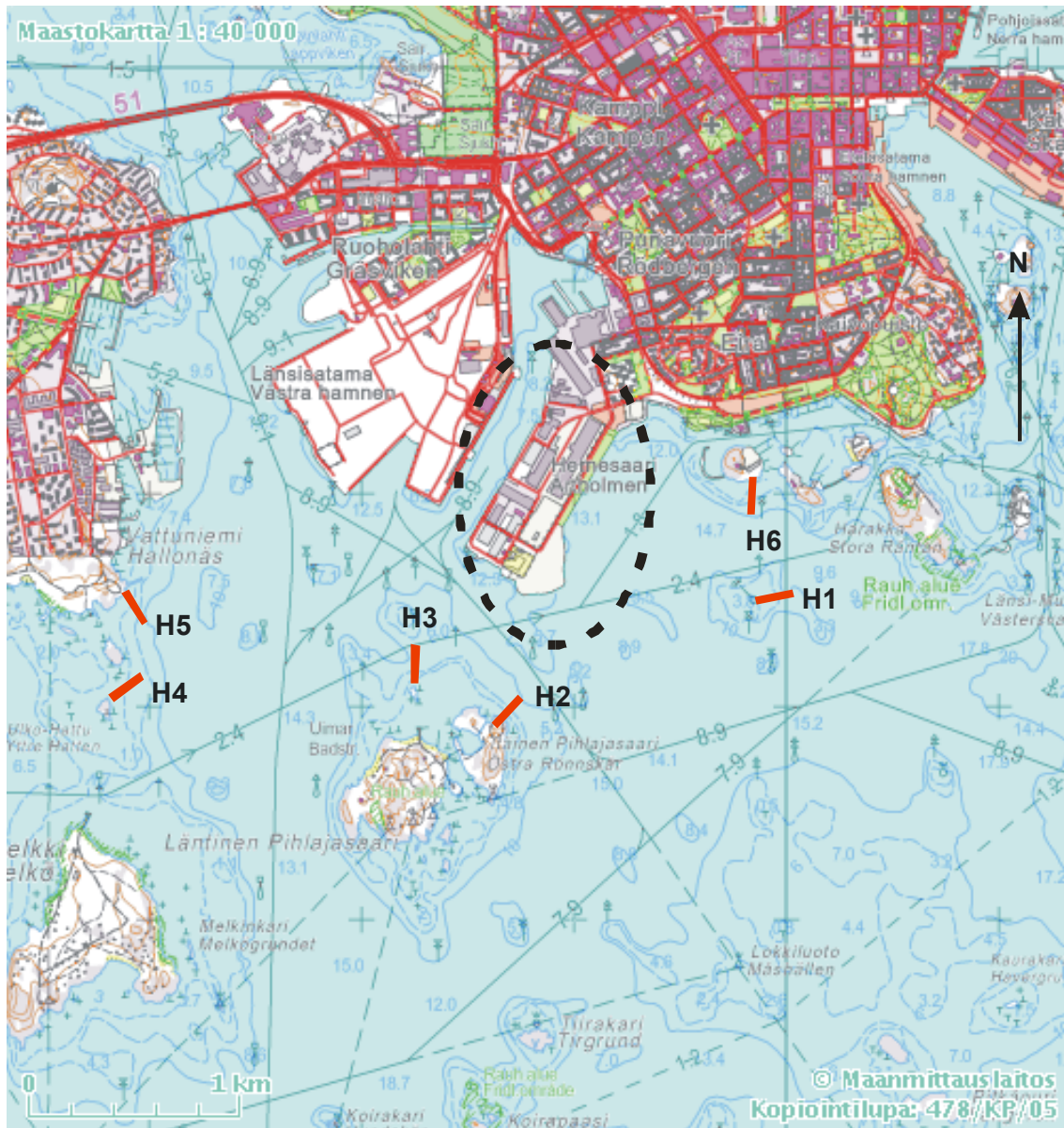
Kuva 1. Vesikasvillisuuden sukelluslinjojen (H1–H6) sijainti. Kuvaan on lisäksi merkitty Hernesaaaren osayleiskaava-alue mustalla katkoviivalla.