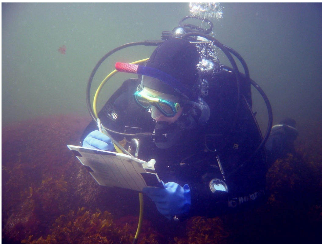
Kuva 2. Sukeltaja kirjaamassa havaintoja muovilevyille.

Linjasukellusmenetelmässä noudatettiin soveltuvin osin SYKE:n makrofyttiseurannan ohjeita (Ruuskanen 2009), joiden mukaisesti kasvillisuuspohjien tilan arvioinnissa tärkeimpänä indikaattorilajina käytettiin rakkolevää. Rakkolevästä mitattiin eri vyöhykkeenosien kasvusyvytydet (alin yksilö, yhtenäisen vyöhykkeen alaraja, optimikohta, yhtenäisen vyöhykkeen yläraja ja ylin yksilö) sekä peittävyys optimisyvytydellä. Yhtenäinen rakkolevävyöhyke määriteltiin vyöhykkeenosaksi, jossa rakkolevän peittävyys on vähintään 30 %.