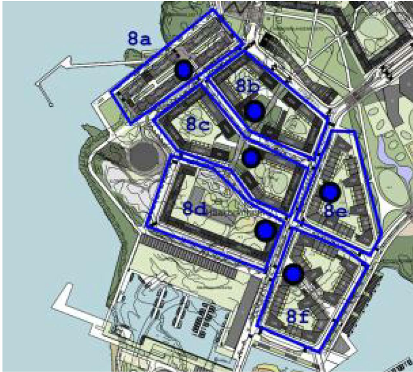
Kuva. Kierrätyshuoneet Haakoninlahti 2:ssa