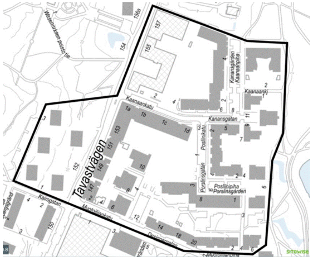
Kuva 1. Tiedotusalue rajattu mustalla viivalla (Määräys 2).