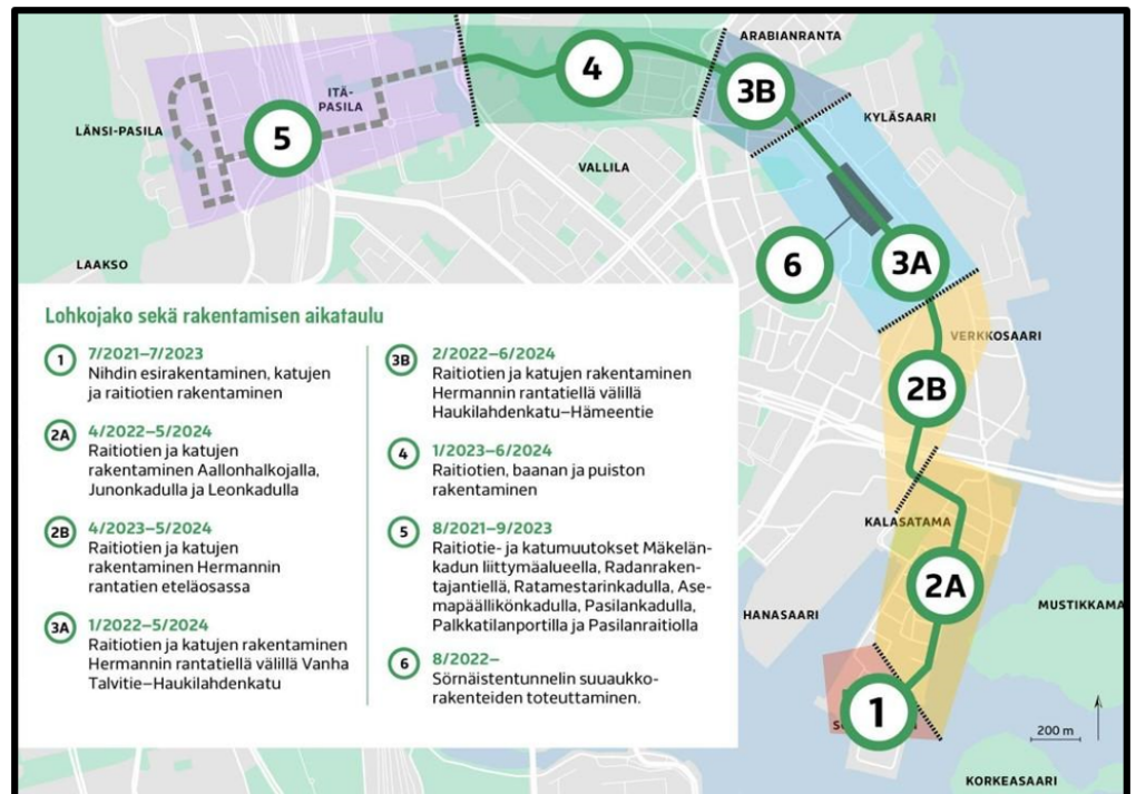
Kuva 2. Kalasatamasta Pasilaan -hankkeen lohkot ja niiden rakennusaikataulut. ( www.kalasadamastapasilaan.fi )

Hanke on jaettu seitsemään lohkoon, jotka on esitetty kuvassa 2. Sörkan sporan toteutusvastuulla ovat lohkot 1, 2A, 2B, 3A sekä 6 ja Karaatilla lohkot 3B, 4 ja 5.