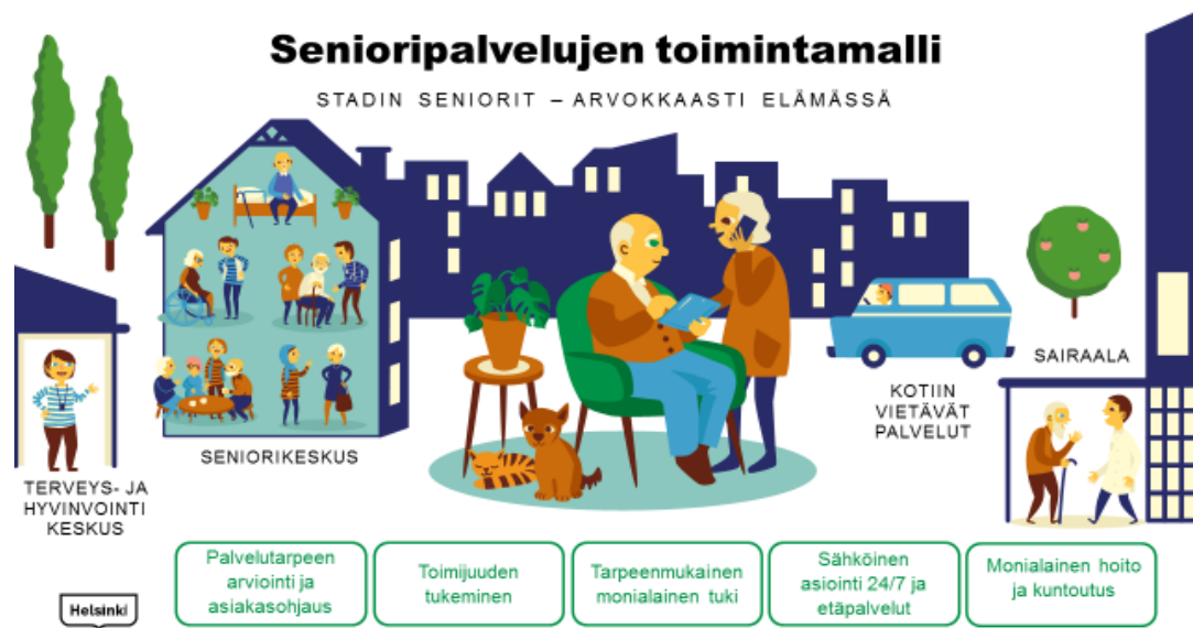
Kuva 1. Senioripalvelujen toimintamalli Helsingissä.

Helsingin kaupungin kotihoidon visio Stadin kotihoito –kunnan hoitoa kotona. Palvelulupaus määriteltiin osana kotihoidon kehittämissuunnitelmaa 2019-2021. Kotihoidon palvelujen lähtökohtana on asiakkaiden omien voimavarojen tukeminen ja kuntouttava työote. Kotihoito tukee ja vahvistaa asiakasta auttamalla ja ohjaamalla niissä toimissa, joihin hän ei itse pysty tai joihin hän ei saa apua esimerkiksi omaisiltaan tai läheisiltään.