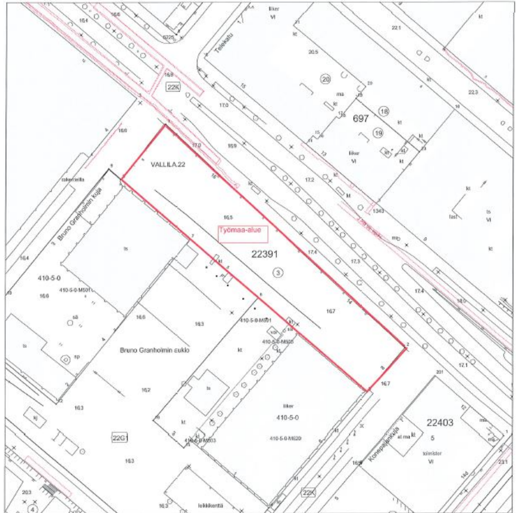
Kuva 2. Ilmoituksen karttaliite

Melua torjutaan rakentamalla työmaan ympärille osittainen umpiainen. Ilmoituksen mukaan tiedote jaetaan osoitteisiin Teollisuuskatu 9-15 ja 16, Konepajankuja 5, 6, 7 ja Aleksis Kiven katu 19.