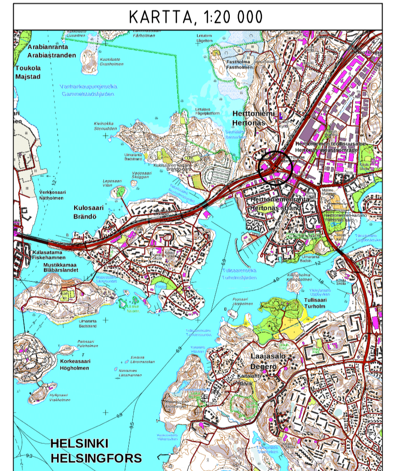
Karttatuote MML maastokarttarasteri 1/2020