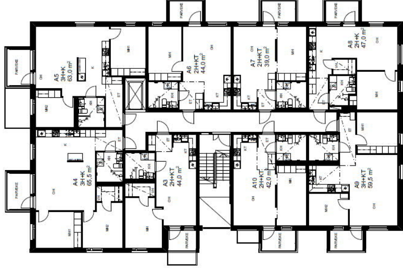
KERROSPOHJUA 2. -10. KERROS