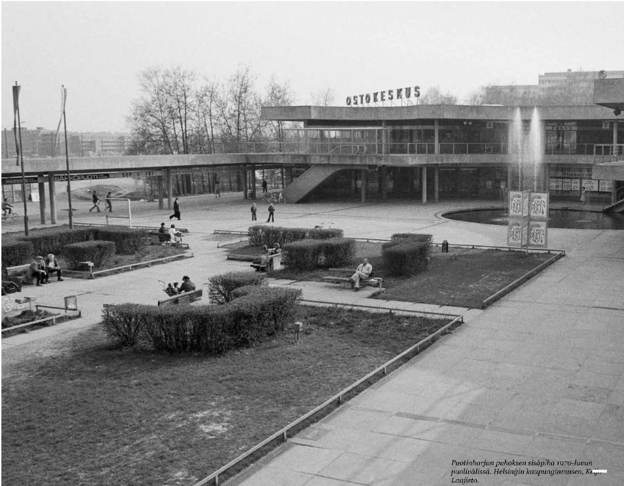
Puotiharjun puhoksen sisäpiha 1970-luvun puolivälissä. Helsingin kaupunginmuseo, Kuvajaia tutkimaton.