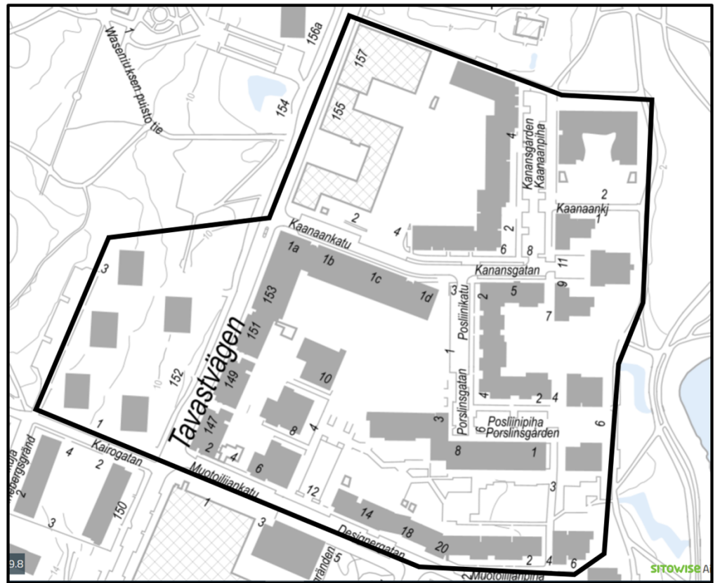
Kuva 1. Tiedotusalue rajattu mustalla viivalla (Määräys 5).