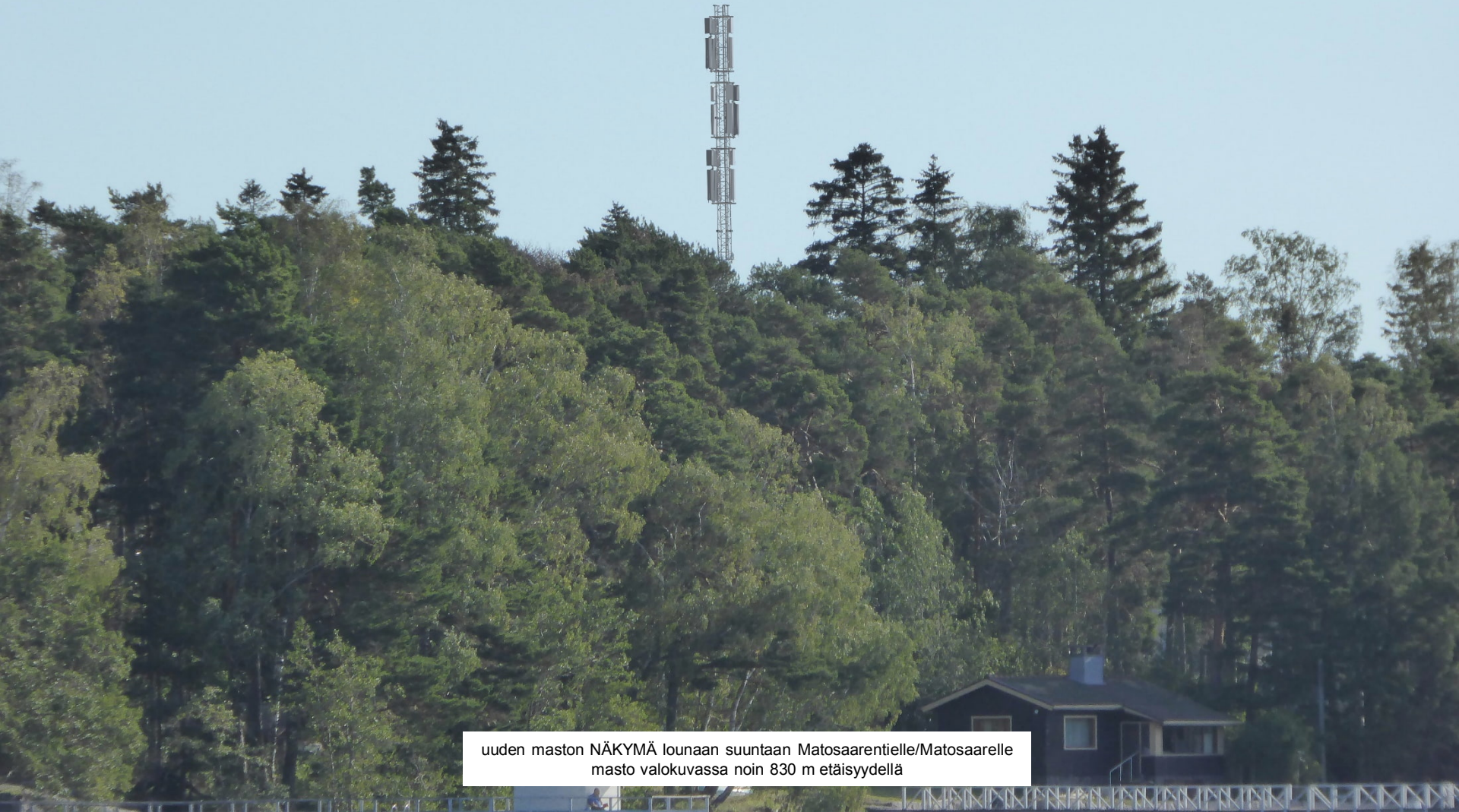
uuden maston NÄKYMÄ lounaan suuntaan Matosaarentielle/Matosaarelle masto valokuvassa noin 830 m etäisyydellä