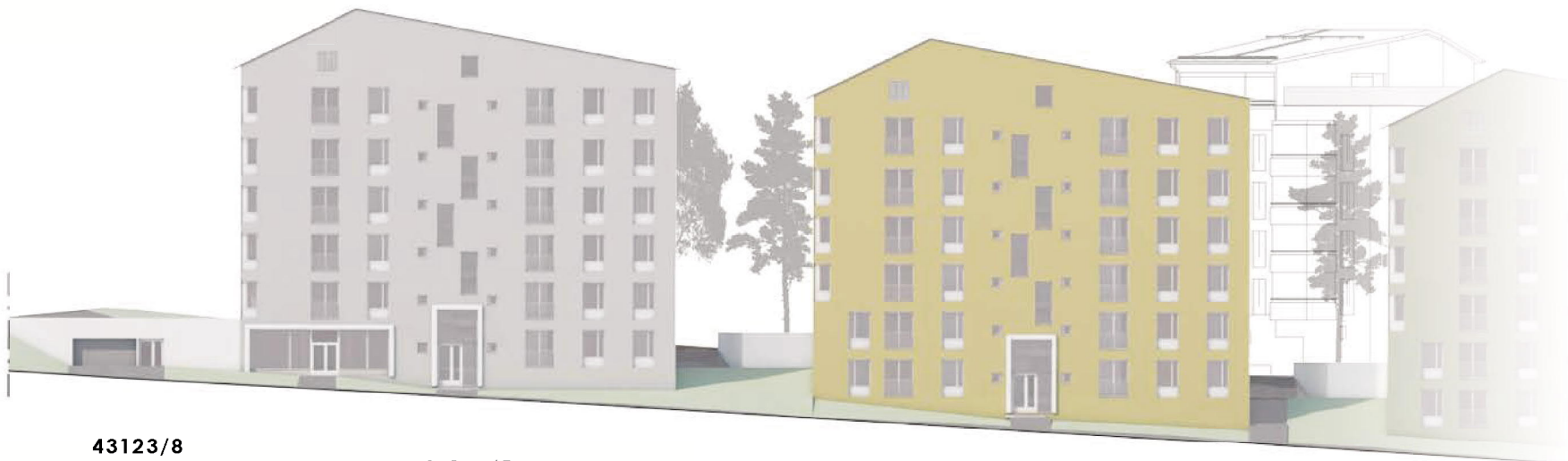
43123/8 P-LAITOS Sisäänajo/-käynti alataso