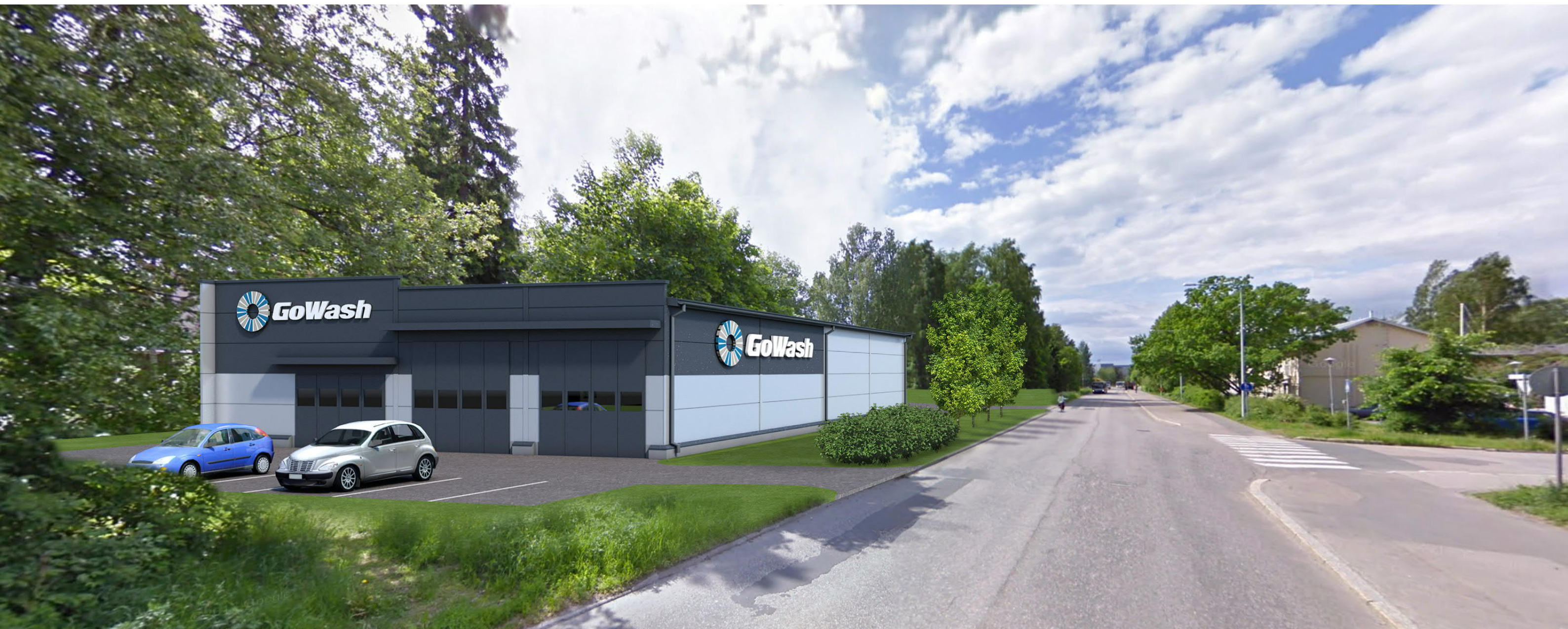
GOWASH AUTOPESULA NÄKYMÄ VARTIOKYLÄNTIELLE